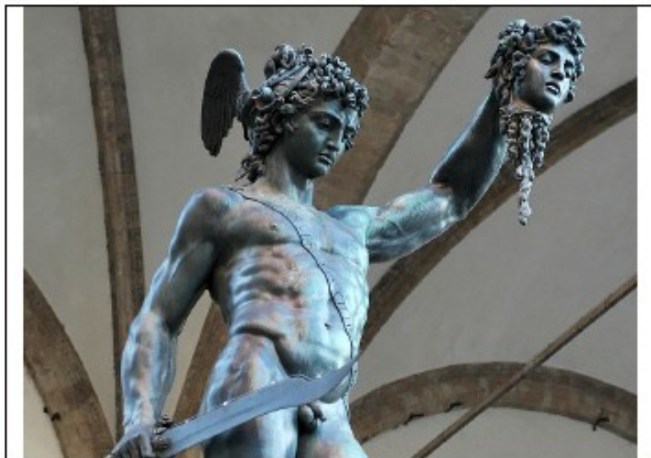
Persée tenant la tête de Méduse, par Cellini du XVI ème siècle Italie.

Également, contrairement à d'autres héros comme Bellérophon à qui les dieux avaient prêté Pégase, le fameux cheval ailé, Persée a su être reconnaissant envers les dieux en leur rendant les objets magiques qu'ils lui avaient prêtés pour accomplir sa quête. Bien plus, pour témoigner de sa gratitude, Persée a offert la tête de Méduse à Athéna qui l'a soutenu tout au long des se épreuves.