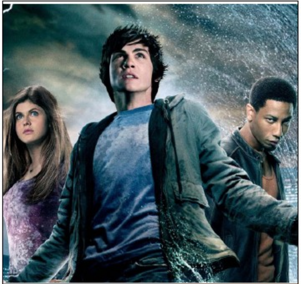
Affiche du film Percy Jackson de Rick Riordan en 2010.

Les deux héros ont de nombreuses quêtes à accomplir pour prouver leur bravoure et sauver leur mère, Danaé pour Persée, Sally pour Percy. Deux héros courageux donc, dont on ne se lasse pas de suivre les aventures !