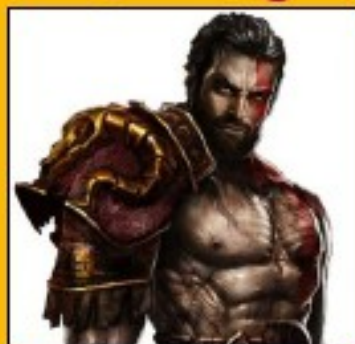
Deimos frère de Kratos

Un oracle prédit à Zeus que l'Olympe tombera à cause d'un mortel possédant des marques rouges sur son corps. C'est pourquoi le frère cadet de Kratos s'est fait enlever par Arès qui le torture. Pour cette raison, Deimos hait Kratos, car celui-ci ne l'a pas sauvé lorsque Arès l'a enlevé. Deimos veut défier Kratos en duel, mais ils se sont alliés une dernière fois pour vaincre Arès. Deimos meurt sous les coups du dieu. Kratos, en l'honneur de son petit frère se peignera sur le corps les mêmes marques rouges que lui. Héraclès a aussi un frère, Iphiclès, qu'il protégera, notamment, des deux serpents envoyés par Héra pour les tuer.