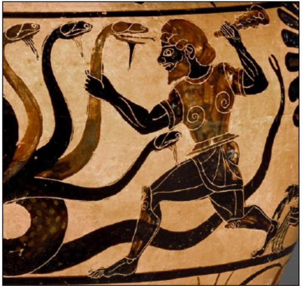
Héraclès affrontant l'hydre de Lerne (vase datant du VI siècle avant JC)

Kratos est haï de tous les dieux de l'Olympe. Seule la déesse Athéna protège Kratos, mais celui-ci va vite se rendre compte qu'elle se sert de lui comme une arme de destruction . Dans la mythologie grecque, Athéna aide aussi Héraclès à tuer les monstres qu'il rencontre au cours de ses fameux Douze Travaux. Quand la force seule ne suffit pas, elle lui inspire des ruses pour vaincre ses ennemis !