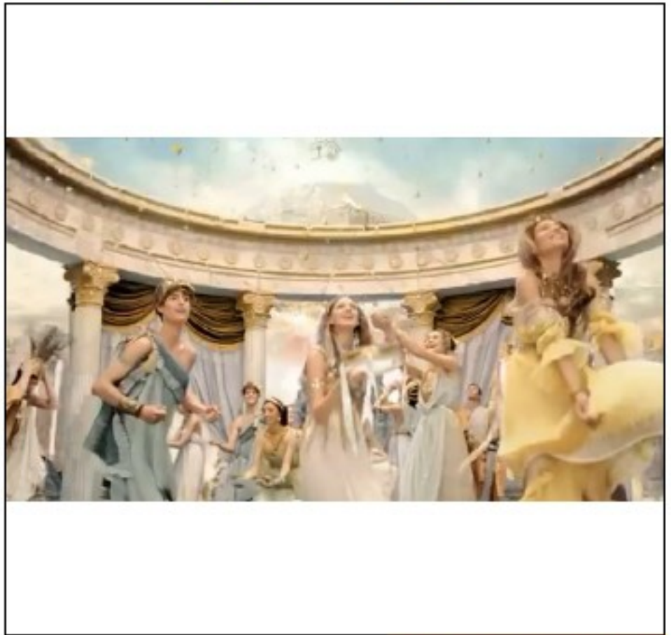
Publicité Ferrero Rocher montrant les dieux de l'Olympe (2013).

Pour conclure, le latin est partout, mais il n'est pas toujours facile de le voir, puisque plus beaucoup de personnes n'étudient cette langue. Même si beaucoup le considèrent comme une langue morte, en réalité, il est bel et bien vivant dans notre vie quotidienne !