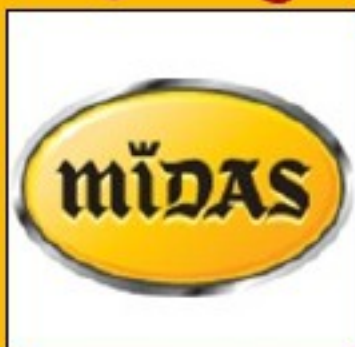
Logo de la société MIDAS.

A l'origine MIDAS est l'acronyme de The Mufler's Installation Dealers' Associative Service. Et n'a aucun rapport avec le mythe. Mais après le rachat de la marque par un français, le créateur s'inspire de la légende de roi Midas pour son logo : la couleur de l'or (car le roi Midas transformait tout ce qu'il touchait en or !) et le point du (i) remplacé par une couronne. Les dirigeants de l'entreprise veulent montrer qu'avec eux il n'y aura aucun problème.